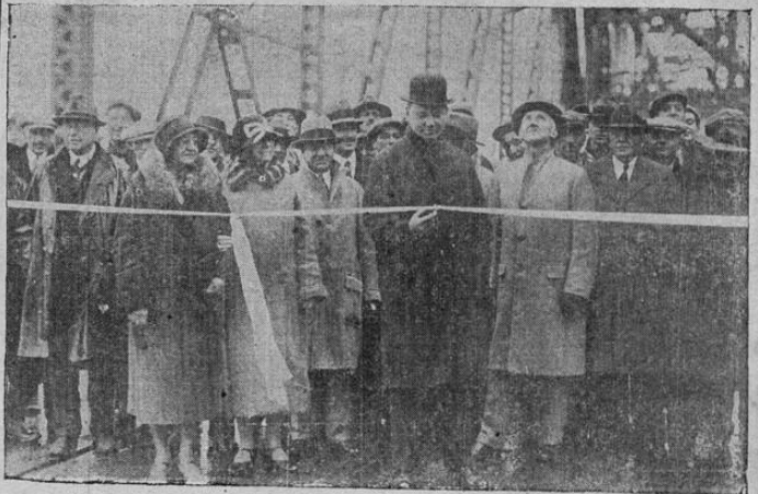
El Comisario de Caminos, Otto Wittppenn, corta n do la cinta para inaugurar el puente sobre el río Hackensack, para el tráfico entre la ciudad de New Jersey y Kearny, en el estado de New Jersey, Estados Unidos. El puente costó más de tres millones de dólares.